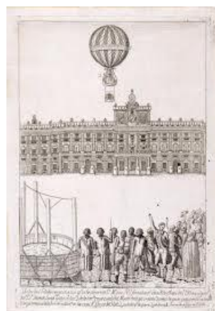
Ascensión de un globo aerostático en la explanada del Palacio Real de Madrid. (8-1-1793)