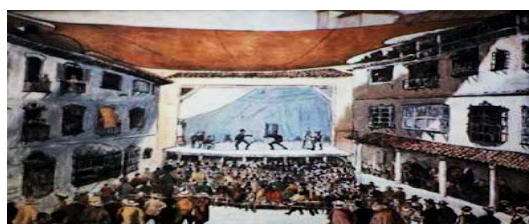
Imagen de un teatro de la época